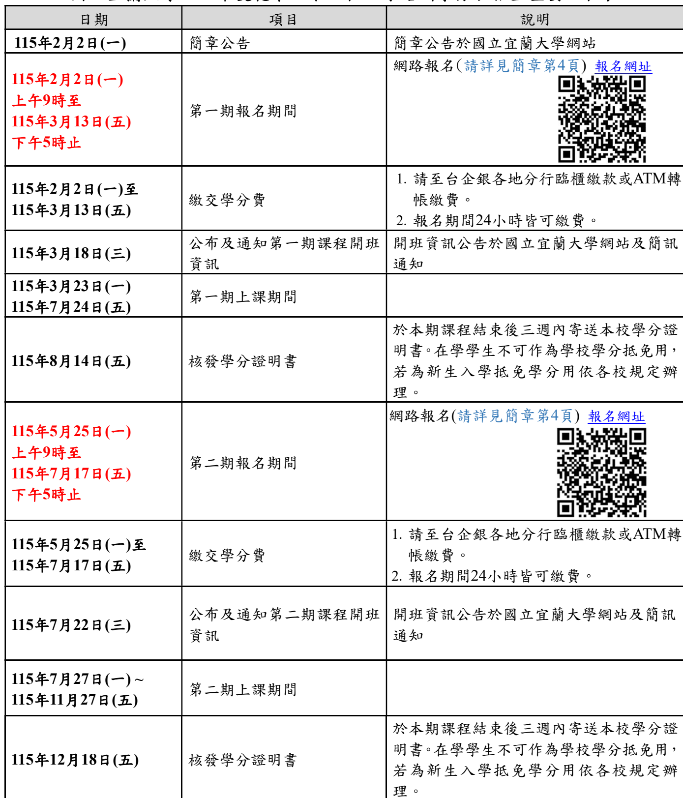
國立宜蘭大學 115 年度花東土木工程人才培訓學分班招生重要日程表