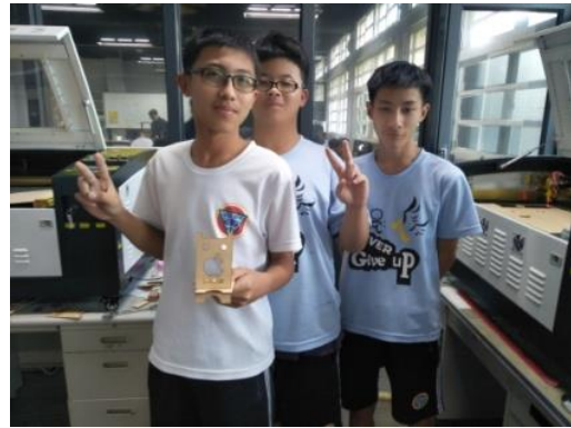
108. 5. 24東石國中職涯體驗-創客體驗營