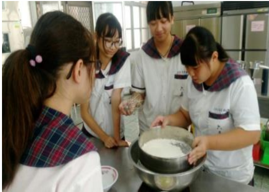
107. 11. 06日，辦理六嘉國中職涯探索體驗營-檸檬炸蛋蛋糕實作