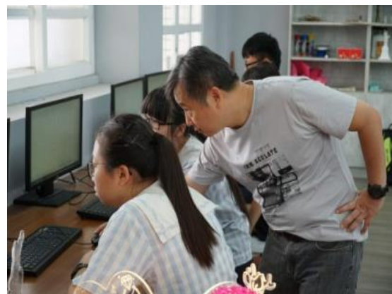
108.6.4嘉新國中職涯體驗-創客體驗營