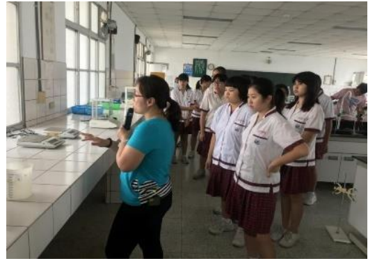
108. 4. 19朴子國中職涯探索體驗-老師進行食品化學儀器設備講解活動照片