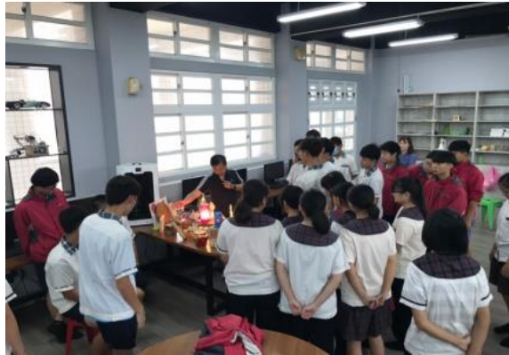
108.5.21辦理六嘉國中職涯體驗-創客體驗營