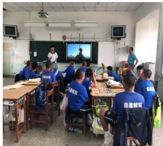
108.5.27東石國中，辦理就近入學與宣導