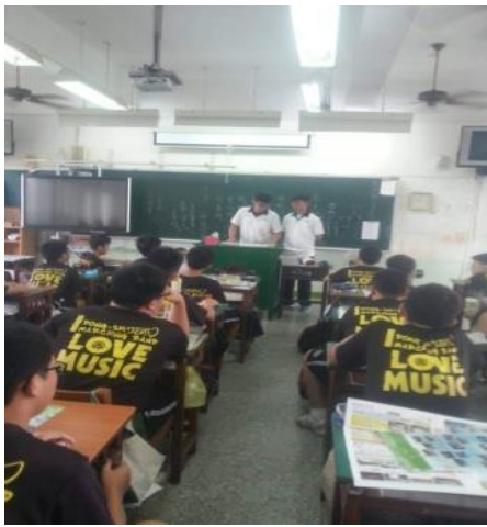
108.5.24鹿草國中，辦理就近入學與宣導