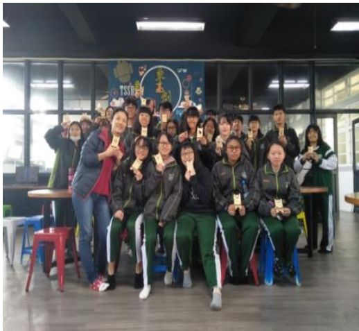
108.6.05永慶高中職涯體驗-創客體驗營