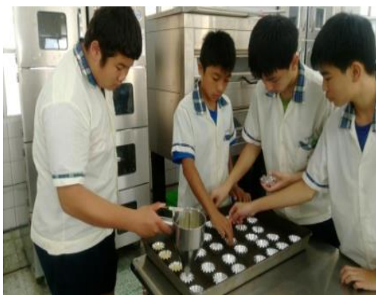
107. 11. 06日，辦理六嘉國中職涯探索體驗營-檸檬炸蛋蛋糕實作