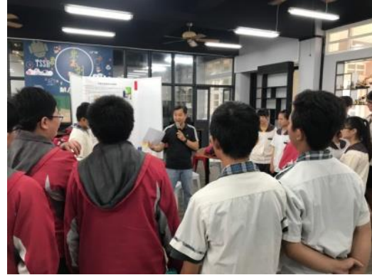
108.5.21辦理六嘉國中職涯體驗-創客體驗營