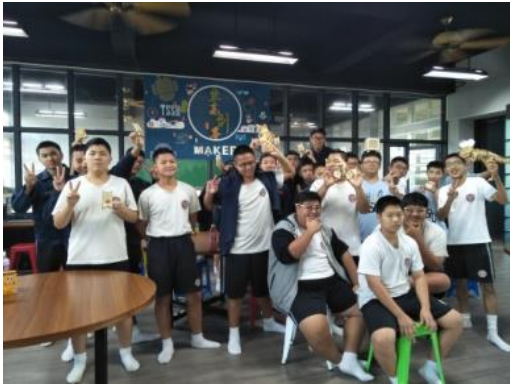
108.5.24東石國中職涯體驗-創客體驗營