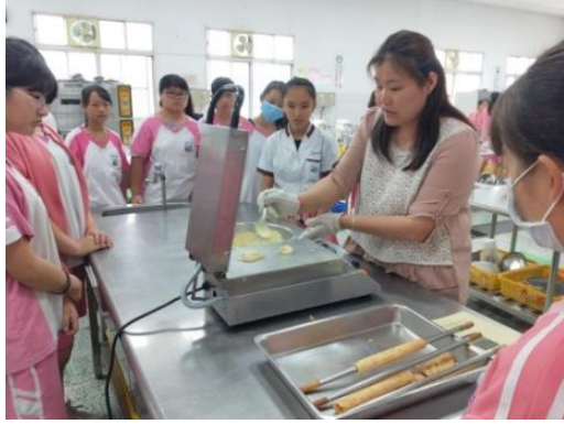
108. 4. 19辦理朴子國中職涯營-蛋捲實作體驗-老師進行示範活動照片