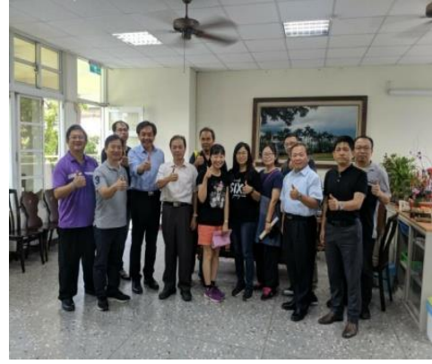
108.5.31朴子國中招生宣導與校長談就近入學理念