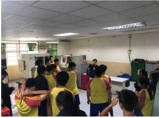
108.5.27布袋國中職涯體驗-創客體驗營