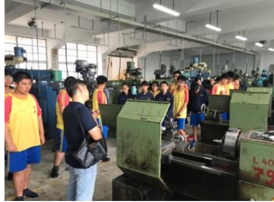
108.5.27布袋國中職涯體驗-創客體驗營