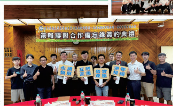
▲與產業界簽署產學合作備忘錄