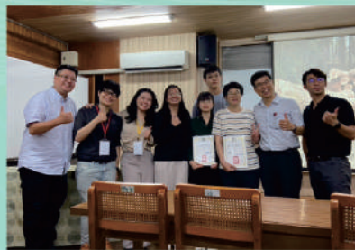
本系師生參加113年中華林產事業協會學術論文研討會榮獲佳績