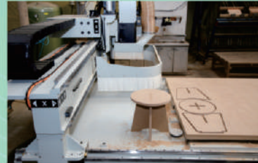
CNC加工機裝機完成後實際操作情形

● 國際交換學生—學生可申請國際姊妹校交換學生，前往法國、西班牙、日本等姊妹校進行為期半年之交換生，亦有法國南特高等林業學院學生蒞系交換。