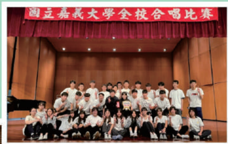
▲榮獲112學年度全校合唱比賽第二名