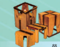
榮獲「2015廢棄木材創意競賽」全國第二名「聚。1>3」