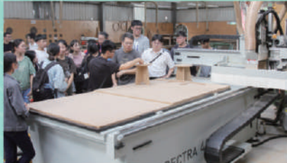
木材利用工廠接受企業捐贈1部CNC加工機

● 辦理海外職場專業實習每年選派大四下應屆畢業生，前往越南家具廠進行現場教學實習2~3個月，落實產學合一，學以致用，畢業即就業。