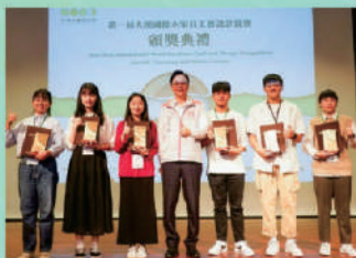
本系學生(左一)參加2023第一屆大溪國際家具工藝設計競賽榮獲銅獎