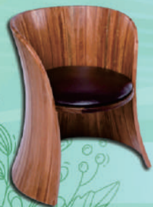
入選「2021臺灣工藝競賽」「正襟為座」